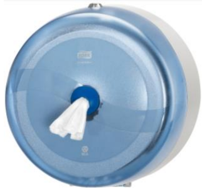
Tork SmartOne – wave design